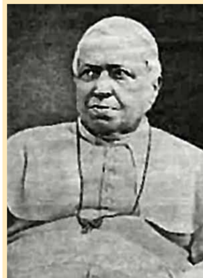
Papst Pius IX. 1792-1878 Papst ab 1846

Unter dem Pontifikat Papst Pius IX. vollzogen sich große Veränderungen für das Papsttum. Der Einfluss der Kirche auf gesellschaftliche Entwicklungen schwand in Folge der neuen Ideen des Nationalismus und Liberalismus sowie der Industrialisierung. Im Gegensatz dazu suchte Pius IX. die religiöse Autorität der römischen Kirche zu stärken. 1864